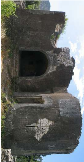
IZGLED - 01