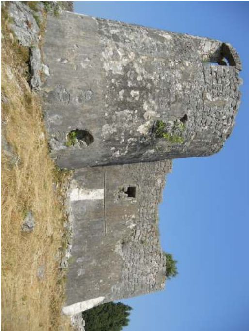
IZGLED - 02