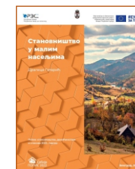
Stanovništvo у малим насељима Драгица Гатарић