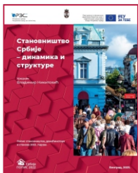
Stanovništvo Srbije - dinamika i strukture Уредник Владимир Никитовић