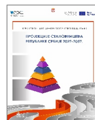
Пројекције становништва Републике Србије, 2022-2052.