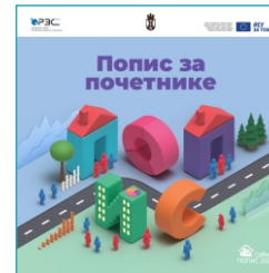
Попис за почетнике