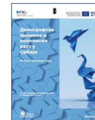
Демографске промене и економски раст у Србији Институт економских наука