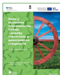
Роми у пописима становништва Србије - између статистике и демографске стварности Александар Кнежевић