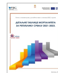
Детаљне таблице морталитета за Републику Србију, 2021-2023.