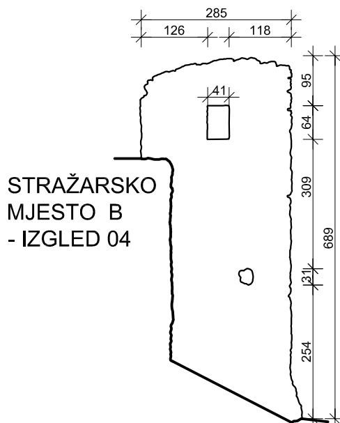
STRAŽARSKO MJESTO B - IZGLED 04