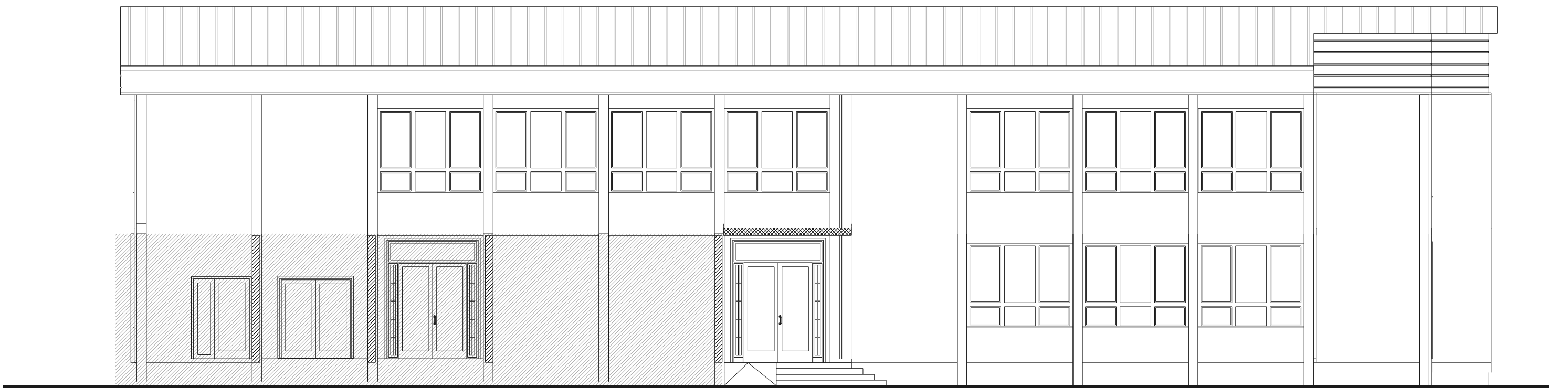
FASADA GLAVNI ULAZ / facade main entrance