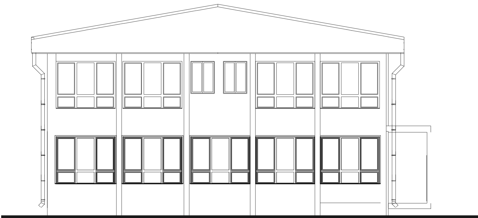
BOČNA FASADA 2 / lateral facade