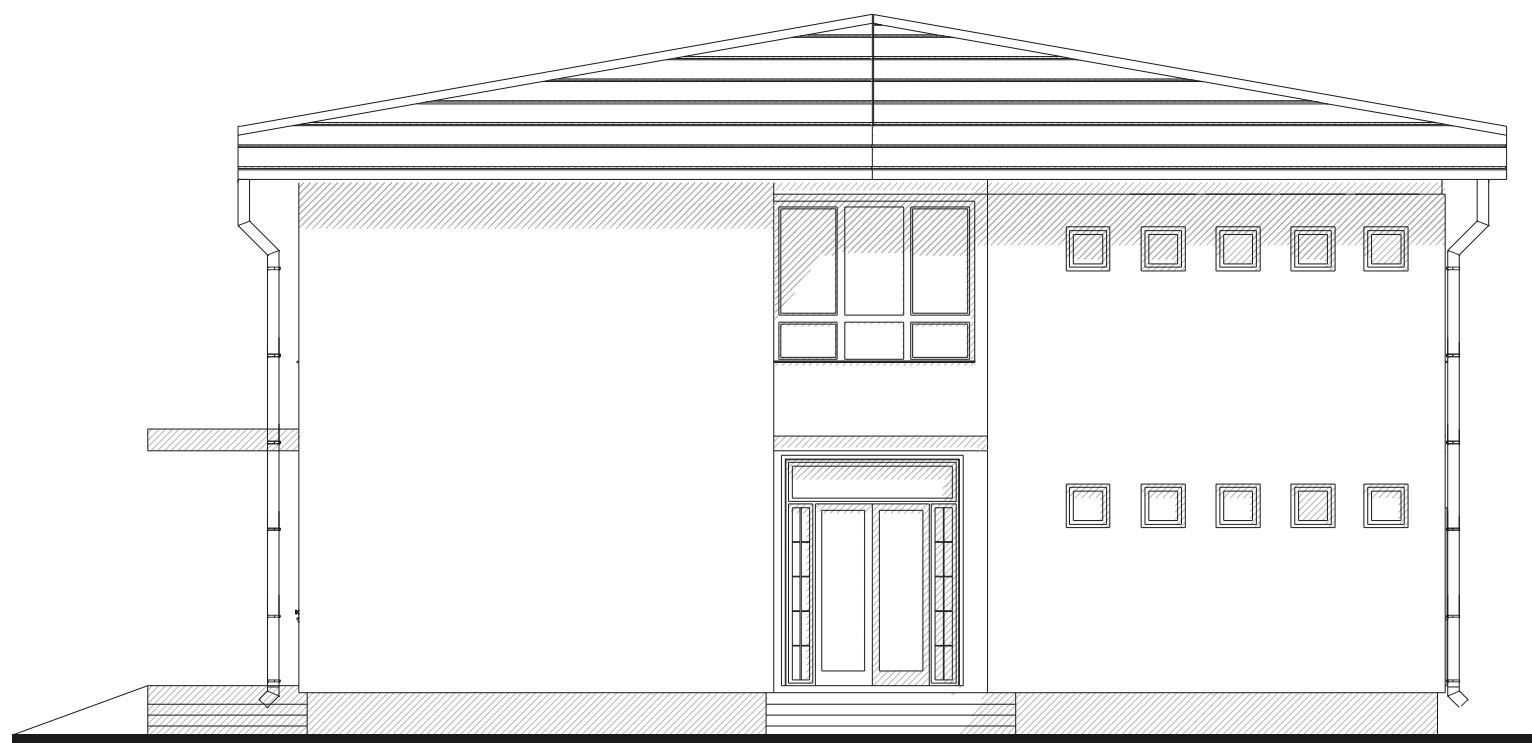
BOČNA FASADA 1 / lateral facade