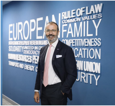
Амбасадор Сем Фабрић, шеф Делегације Европске уније у Републици Србији

Дан Европе, који се одржава 9. маја сваке године, слави мир и солидарност у Европи. Обележава годишњицу историјске „Шуманове декларације”, од 9. маја 1950. године, која се сматра почетком онога што се током протеклих седам деценија развило у данашњу Европску унију.